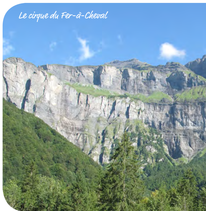
Le cirque du Fer-à-Cheval

Retour à l'hôtel en fin d'après-midi, Dîner dégustation des truites pêchées puis logement.